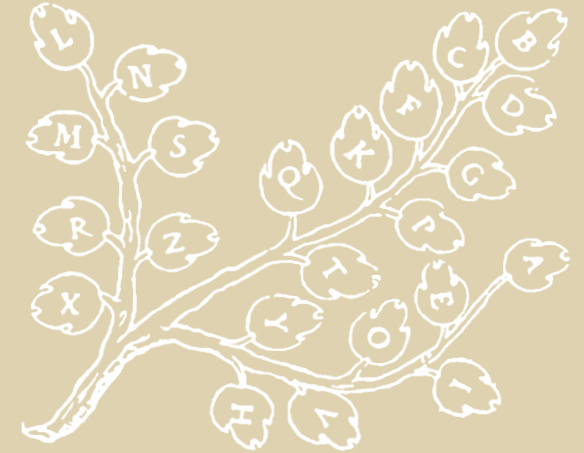
LA BRANCHE D'IGNORANCE