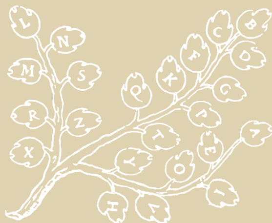
LA BRANCHE DIGNORANCE